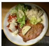
Steak vom Grill Kartoffelsalat 5 Salate (Rüebli, Chabis, Rotchrut, Tomaten) Kaffee mit Dessert